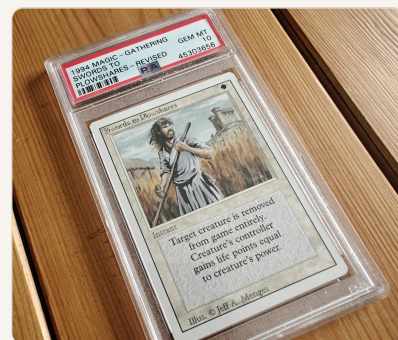
PSA 10 GEM MT · MtG Revised 1994

PSA on greidausmaailman tunnetuin brändi ja se antaa greidatulle kortille parhaan jälleenmyyntiarvon. PSA 10 on helpommin saavutettavissa uusilla korteilla - vanhoilla hyvin haasteellista. Asteikko 1-10, ei subgradeja. PSA osti BGS:n - markkinakehitys on vielä kesken. Huomio: PSA perii komissiopalkkion kortin arvonnoususta - lue ehdot huolella ennen arvokkaiden korttien lähetystä, sillä lasku voi tulla yllätyksenä jälkikäteen.