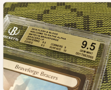
BGS 9.5 GEM MINT - FaB Welcome to Rathe Alpha, Braveforge Bracers. Centering 9.5, Edges 9.5, Surface 10 - mutta Corners 9 teki tästä B+-n eikä Quadia.

Jotkut yritykset, erityisesti BGS, antavat jokaiselle neljälle kategorialle oman arvosanansa lopullisen kokonaisarvosanan lisäksi. Nämä subgradet kertovat tarkemmin missä kortin vahvuudet ja heikkoudet ovat, ja niillä voi olla hyvinkin merkittävä vaikutus myyntihintaan.