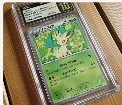
CGC Pristine 10 · Pokémon Leafeon JP

CGC on tunnettu alun perin sarjakuvista ja on laajentanut kortteihin. Tällä hetkellä yksi nopeimmista ja halvin vaihtoehto. CGC Pristine sijoittuu tasoltaan PSA 10:n ja BGS Black Labelin välimaastoon - vaativampi kuin PSA 10, mutta ei tuo markkinoilla enempää arvoa. Kasvava tunnettuus, mutta PSA:ta heikompi jälleenmyyntiarvo.