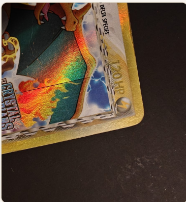
Cut line - selvästi näkyvä viiva holopinnalla Crystal Guardians Charizardissa.

Holokorteilla tilanne on erityisen haastava kahdesta syystä. Ensimmäkin pienet naarmut holossa ovat helposti näkymättömiä paljaalle silmälle, mutta greidaajat havaitsevat ne - ja PSA on tunnetusti erityisen tarkka juuri holo-naarmuista. Ne tekevät yli PSA 8 -arvon käytännössä mahdottomaksi. Toiseksi niin sanottu cut line eli sauma holopainatuksessa voi pudottaa arvosanaa merkittävästi. Cut line ei tunnu pinnassa sormella tunnustelemalla, mutta se näkyy selvästi viivana holopinnalla - varsinkin valoa