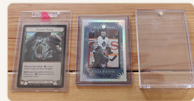
Vasemmalta: semi-rigid ✓, toploader ja magnet holder x

Myös säilytyksessä kannattaa olla tarkkana: ringholder-kansiot ovat korteille riskialttiita. Sivuja väärin käännettäessä kortit voivat taittua muovitaskuissa - ja kerran taittunut kortti ei suoristu takaisin. Arvokkaat kortit kannattaa säilyttää top loaderissa tai semi-rigidissä erillisessä kotelossa.