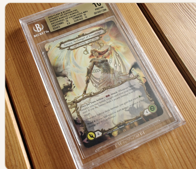
BGS Pristine 10 · Flesh & Blood Dynasty

Esimerkiksi Mega Charizardin Black Label -kappaleita on olemassa alle 20, vaikka PSA 10 -kappaleita on tuhansia.